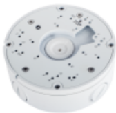
ขายึดเสา